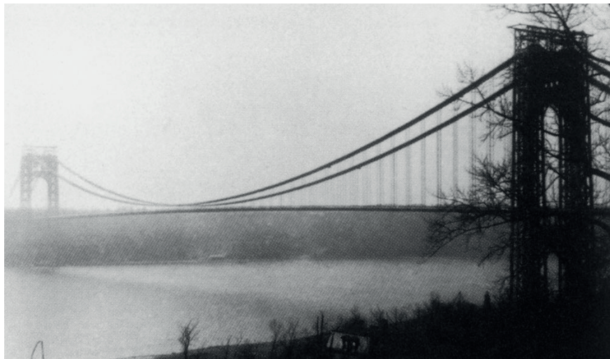
George Washington Bridge in New York, Aufnahme von Dietrich Bonhoeffer 1930/31

Internationale Bonhoeffer-Gesellschaft Deutschsprachige Sektion e.V.